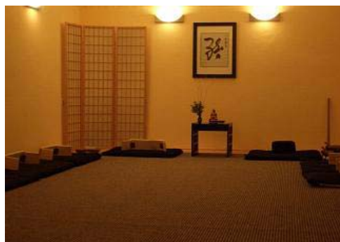
Übungsraum (Dojo) Balance-Institut

Zeiten: Beginn am 13.04.2007 um 16.00 Uhr Ende am 15.04.2007 um 13.00 Uhr